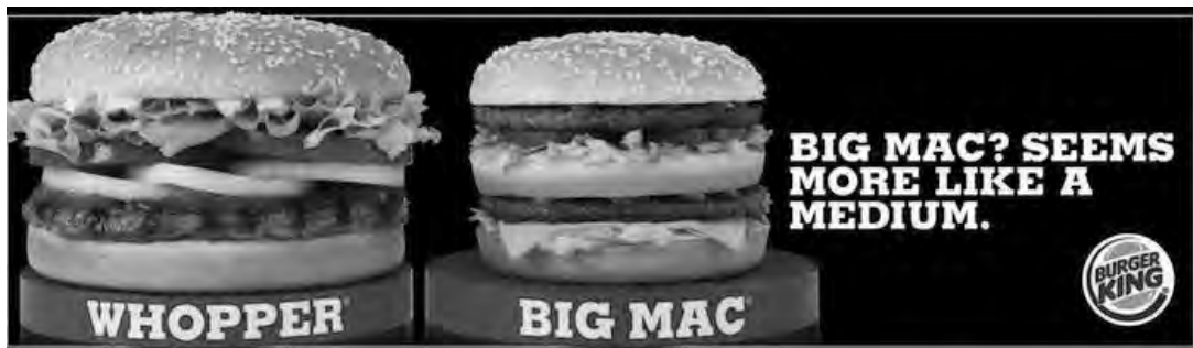
Figure 1 https://neilpatel.com/blog

Gebruik die advertensie hieronder en beantwoord Vrae 6 en 7.