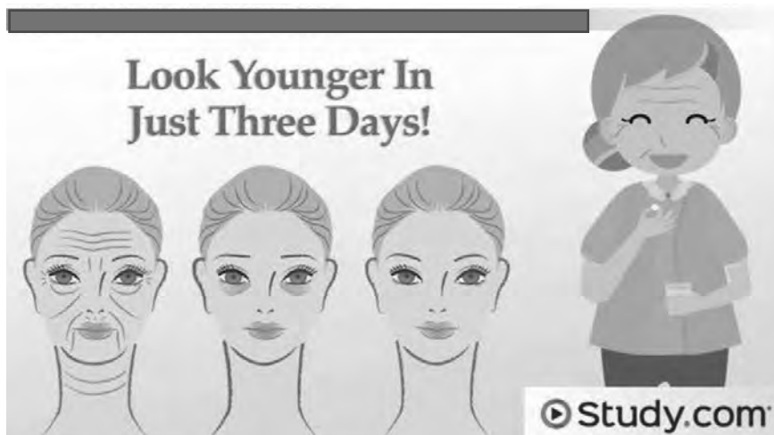
Figuur 1: https://study.com

Gebruik die illustrasie hier onder en beantwoord Vrae 6 en 7.